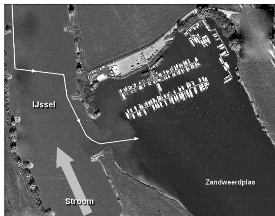
Fig.3 Tegenstrooms de haven in

Iedere schipper zal je kunnen vertellen dat het binnenvaren van een haven het beste tegen de stroom in kan gebeuren. De boot is dan namelijk veel beter bestuurbaar doordat er veel meer water langs het roer loopt dan wanneer je de stroom mee hebt: het roer werkt zelfs nog goed wanneer je ten opzichte van het land bijna stilligt! Komend vanuit de richting Olst steek je dus kort voor de haveningang over naar de bakboord wal Fig.3 . Gladde boten zullen dat vaak al eerder doen, afhankelijk van de wind en om een lastige onderstroom op het laatste stuk aan de SB wal te vermijden.