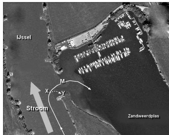
Fig.4 Voorstrooms de haven in

Als er veel verkeer is kun je natuurlijk even de haven voorbijvaren, rondmaken (Kribbigheden 4, 1a) en verder de haven naderen zoals je dat komend vanuit de stad zou doen, Fig.4 .